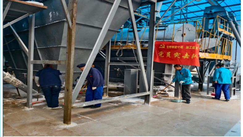
2024年11月13日，加工盐车间党支部组织车间清洁活动。活动中，党员突击队与生产班组人员携手合作，充分利用停产间隙，对车间进行了全面而细致的打扫。此次活动不仅显著提升了车间的环境卫生，更增强了车间的凝聚力和责任感。（伏胜杰）